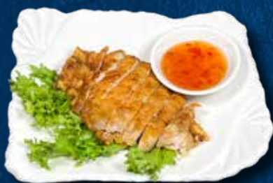
69 MAIALE FRITTO