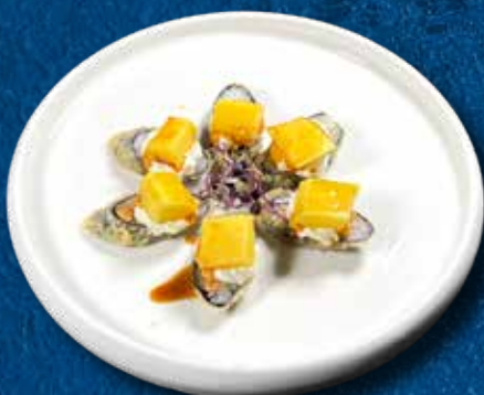
95 HOSO MANGOFURAI 6PZ

Salmone, philadelphia, mango e teriyaki € 10.00