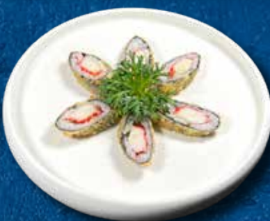
93 HOSO SURIMI*FURAI 6PZ