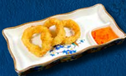
70 CALAMARI* FRITTI