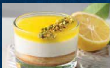
COPPA DI LIMONE