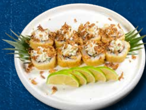
98 HOTFURAI 8PZ

Avocado, miura, philadelphia, cipolla frita e teriyaki € 10.00