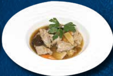
235 VITELLO FUNGHI BAMBÙ