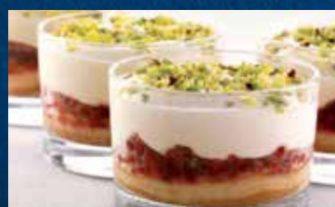
COPPA MASCARPONE E LAMPONI