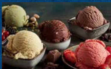
GELATO 3 PALLINE

gusti a scelta: Crema / Cioccolato / Nocciola / Fragola € 2.50