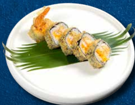
97 FUTO EBIFURAI 5PZ

Gambero* tempura, cheddar e teriyaki € 12.00