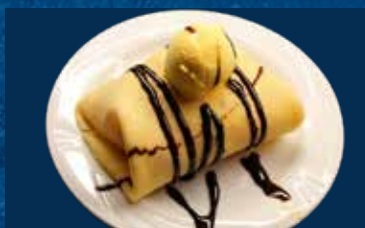
GELATO ALLA PIASTRA

gusti a scelta: Crema / Cioccolato / Nocciola / Fragola € 2.50