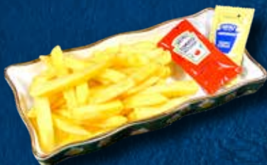
67 PATATINE FRITTE ✓