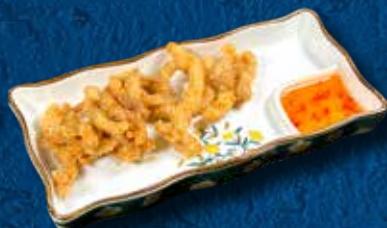
68 POLLO FRITTO