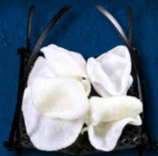
66 NUVOLETTE DI DRAGO