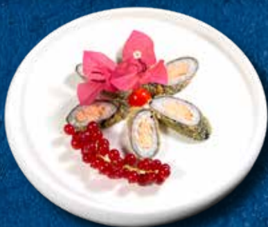
92 HOSO SAKE FURAI 6PZ