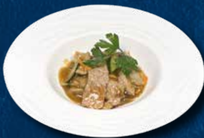
237 VITELLO SATÈ