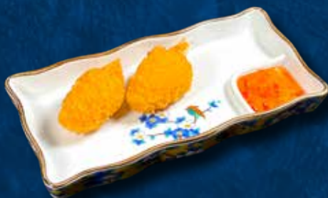
71 CHELE DI GRANCHIO*