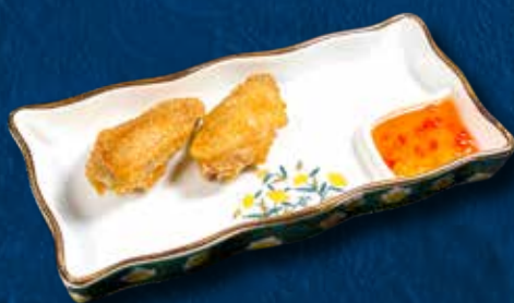
72 ALETTE DI POLLO