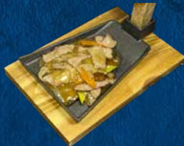
238 TEPPAN VITELLO

Carote, cipolla, funghi, zucchine e bambù