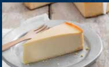
CHEESECAKE NEW YORK