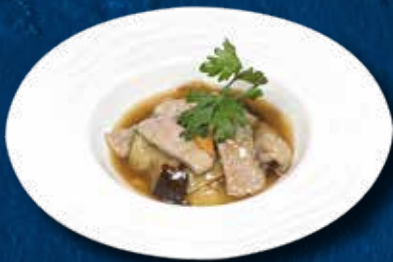
234 VITELLO PATATE