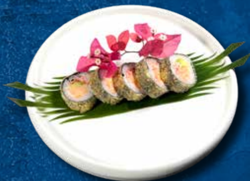
96 FUTOFURAI 5PZ

Salmone, avocado, surimi* e teriyaki € 10.00