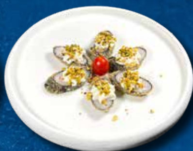
94 HOSO PISTA FURAI 6PZ

Salmone, philadelphia, pistacchio e teriyaki € 11.00