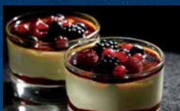
COPPA CREME BRULEE E FRUTTI DI BOSCO