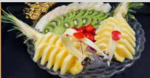
FRUTTA DI STAGIONE

gusti a scelta: Crema / Cioccolato / Fragola / Pistacchio +€0.50 € 3.00