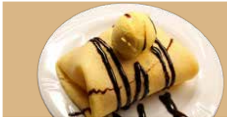
GELATO ALLA PIASTRA

gelato ricoperto da una cialda morbida gusti a scelta: Crema / Cioccolato/ Pistacchio +€0.50 € 5.00