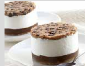
RICOTTA E CIOCCOLATO