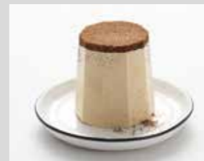
SEMIFREDDO AL CAFFÈ