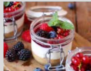
CHEESECAKE FRUTTI DI BOSCO