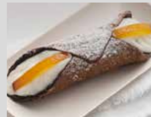
CANNOLO DI RICOTTA