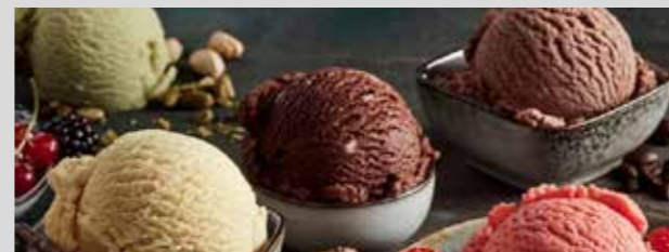
GELATO 3 PALLINE

gusti a scelta: Crema / Cioccolato / Fragola / Pistacchio +€0.50 € 3.00