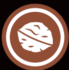
8. Frutta a guscio