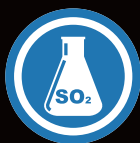
12. Anidride solforosa e solfiti