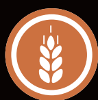
1. Cereali che contengono glutine

Regolamento CEE 1169/2011 D.L. n.109 del 27 gennaio 992 sezione III-D.L. n.114/2006 I nostri piatti possono contenere allergeni.